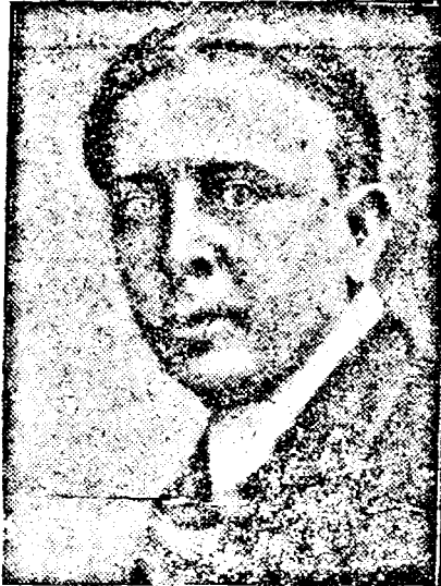
D. OCTAVIAN GOGA Președintele Consiliului de Miniștri

Mai întâi să nu se vadă în acțiunea noastră de guvern, menită să introneze la cârma Statului reparațiunea românească, un prilej de împilare a drepturilor firești, de care trebuie să se bucure minoritățile din țară. Dreptate: da, prigonire; nu! Cel care rostește cu sufletul frământat aceste cuvinte a luptat prea mult pentru libertate, ca să se poată transforma în opresor. De aceea, vorbă limpede dela început; toți minoritarii, care se vor încadra prin gândul și faptele lor în ideea de Stat, vor putea să-și exercite atât drepturile lor cetățenești, cât și notele distincte ale origini lor etnice. În această privință Guvernul va veni cu precizuni, după ce va lua contactul cu fiecare categorie în parte prin reprezentanții ei cunoscuți.