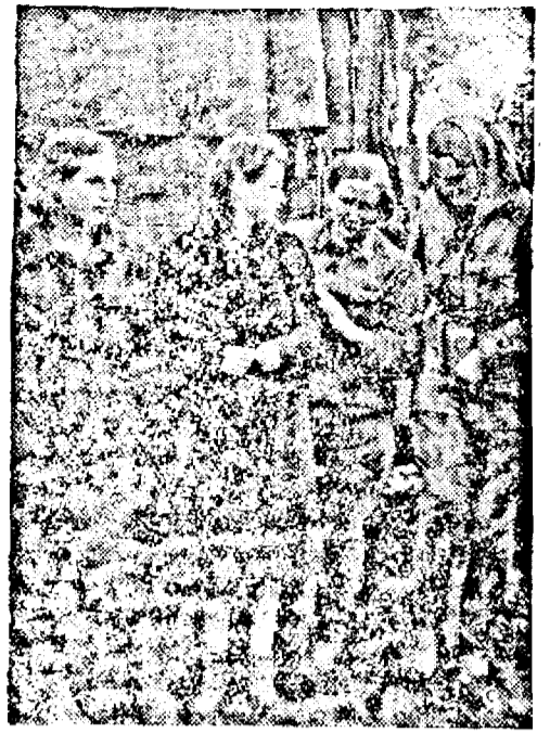
Doă fete bolșevice, cari au luptat pe front împreună cu soldații „au ajuns prizoniere ale germanilor.