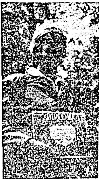
Pe primul loc, Petru Bodnari de la sectorul de exploatare Bîrzava.