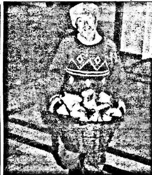
Așteptând gazul metan, este bun și coșul cu lemne

În Ineu există o singură Asociație agricolă („Cotul Morii”) care exploatează 860 de hectare. Cele 2400 ha de pășune oferă condiții ideale pentru crescătorii de animale, iar în viitorul apropiat primarul își propune să construiască și o cantină socială pentru persoanele defavorizate. Tot legat de agricultură, prin Ineu