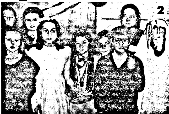
2 fiind martori ai momentului - întâlnirea cu elevii școlii, antrenată în activități diverse, grupate pe ateliere.

Partenerii s-au reunit la școala coordonatoare a proiectului și timp de trei zile au încercat să se cunoască și să afle cât mai multe despre realitățile specifice fiecăreia dintre zonele de proveniență. Invitații s-au întâlnit cu oficialități, profesori ai școlii ardelene, la varii niveluri, au vizitat instituții de cultură etc. Cea mai convingătoare a fost însă - suntem siguri,