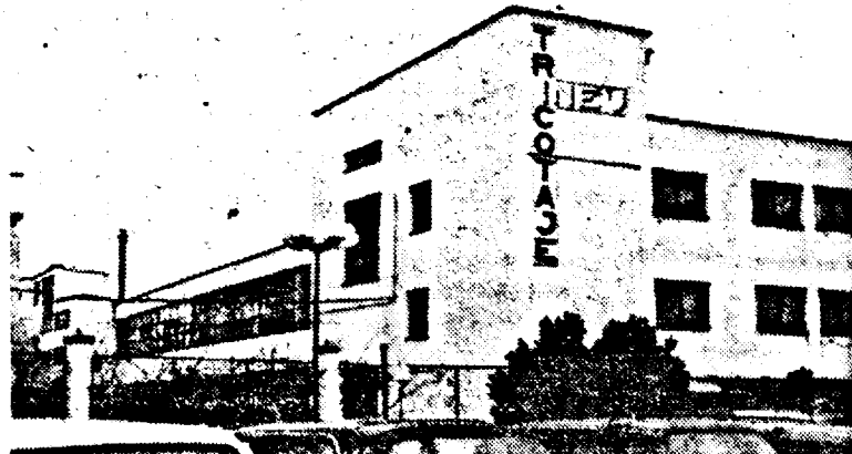
Cu atâtea fabrici de confecții, la Ineu femeile câștigă mai mult decât bărbații

Ținând cont și de dezvoltarea infrastructurii (centura, Spitalul, grupurile școlare etc.), considerăm că în scurt timp Ineul va egala condițiile de trai existente deocamdată doar în municipiile reședință de județ. În rest, reținem doar of-ul primarului Mehelean: „Ce bine-ar fi dacă aș avea la dispoziție și Unitatea militară de lângă gară, unitate care în prezent nu-și mai justifică activitatea...”