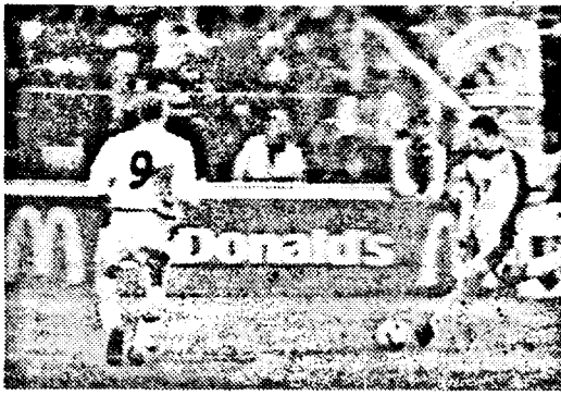
Contra șutează și inscrie

● min. 85 - același Panca are o minge în careu, dar șutează alături. ● min. 87 - Vugdalic șutează violent din lovitură liberă de la 35 m, Lobont acordă comer. ● min. 90 - Ilie șutează mult peste poartă din afara careului, după un comer. ● min. 90 - Niculae, la 10 m, lateral dreapta ratează golul prelungirilor, iar pe contraatac Pavlovic este oprit în extremis de Lobont. ◆ România a ratat calificarea la al 4-lea Campionat Mondial consecutiv, fiind eliminată la baraj de un adversar care și-a construit succesul pe ghinionul teribil al tricolorilor. Slovenii nu și-au creat mai mult de 4 ocazii în cele 180 de minute disputate, dar au marcat de 3 ori, în timp ce elevii lui Hagi s-au jucat cu ocaziile la Ljubljana, iar în retur n-au mai avut forța să se impună. Tricolorii au jucat crispat pe "Ghenoea" și odată cu scurgerea timpului au căzut pradă precipitării, încercând să străpungă apărarea bine organizată a oaspeților.