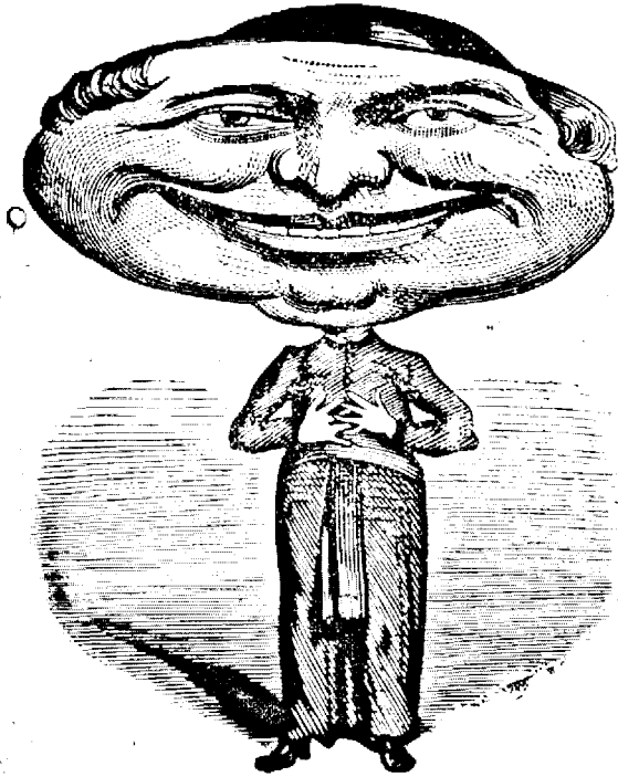
Inainte de alegere.