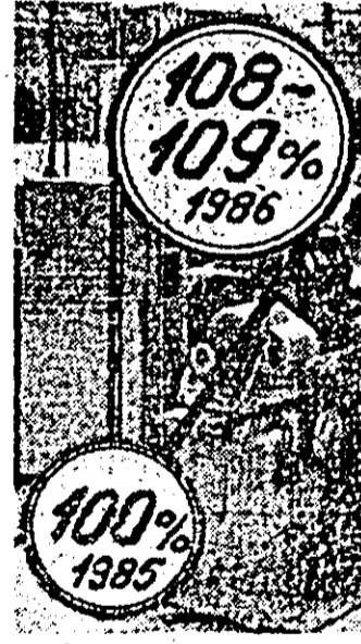
Dinamica valorii producției marfă.

teria primă, pe tot traseul tehnologic. Pompe gigant, zece și zece de pompe, vitale pentru întreaga producție. Și tocmai acestea dădeau cele mai mari dureri de cap. Se înfundau, se defectau prea adesea, se lveau scăpări, lipseau piesele de schimb la aceste utilaje aduse din import, iar cei care trebuiau să le pună la punct erau puțini și fără experiență. Mai tîrziu aveam să-mi dau seama că unii erau și fără prea multă trăgere de inimă. Așa cum m-au povățuit comunistii, am continuat să învăț, am urmat liceul seral și m-am specializat în întreținerea, repararea și exploatarea pompelor... Devenind membru de partid, tovarășul Giurumea a I. BORȘAN (Cont. în pag. a III-a)