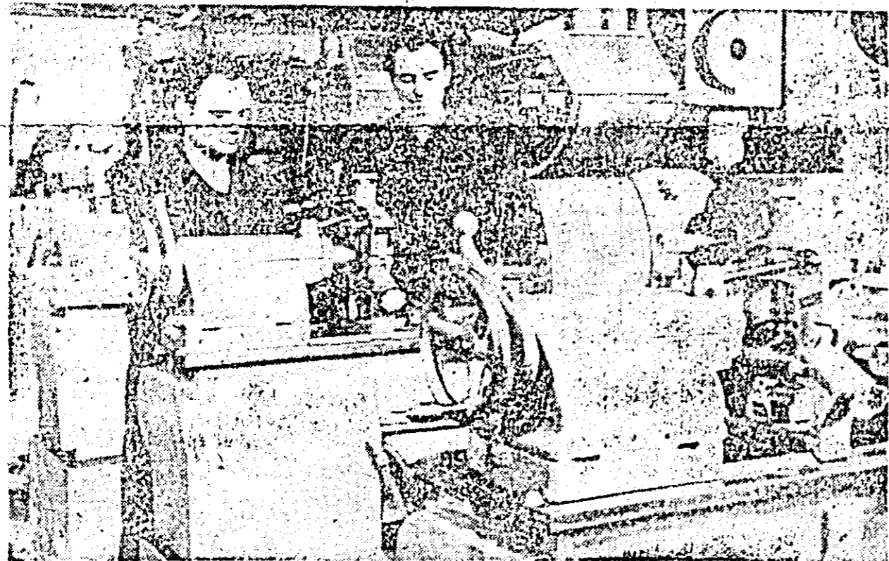
Strungurile arădane se afirmă tot mai mult pe piața externă. Ga na largă în care sînt produse, calitatea execuției sînt caracteristici care impun strungurile românești. ÎN CLISEU: aspect din secția montaj.