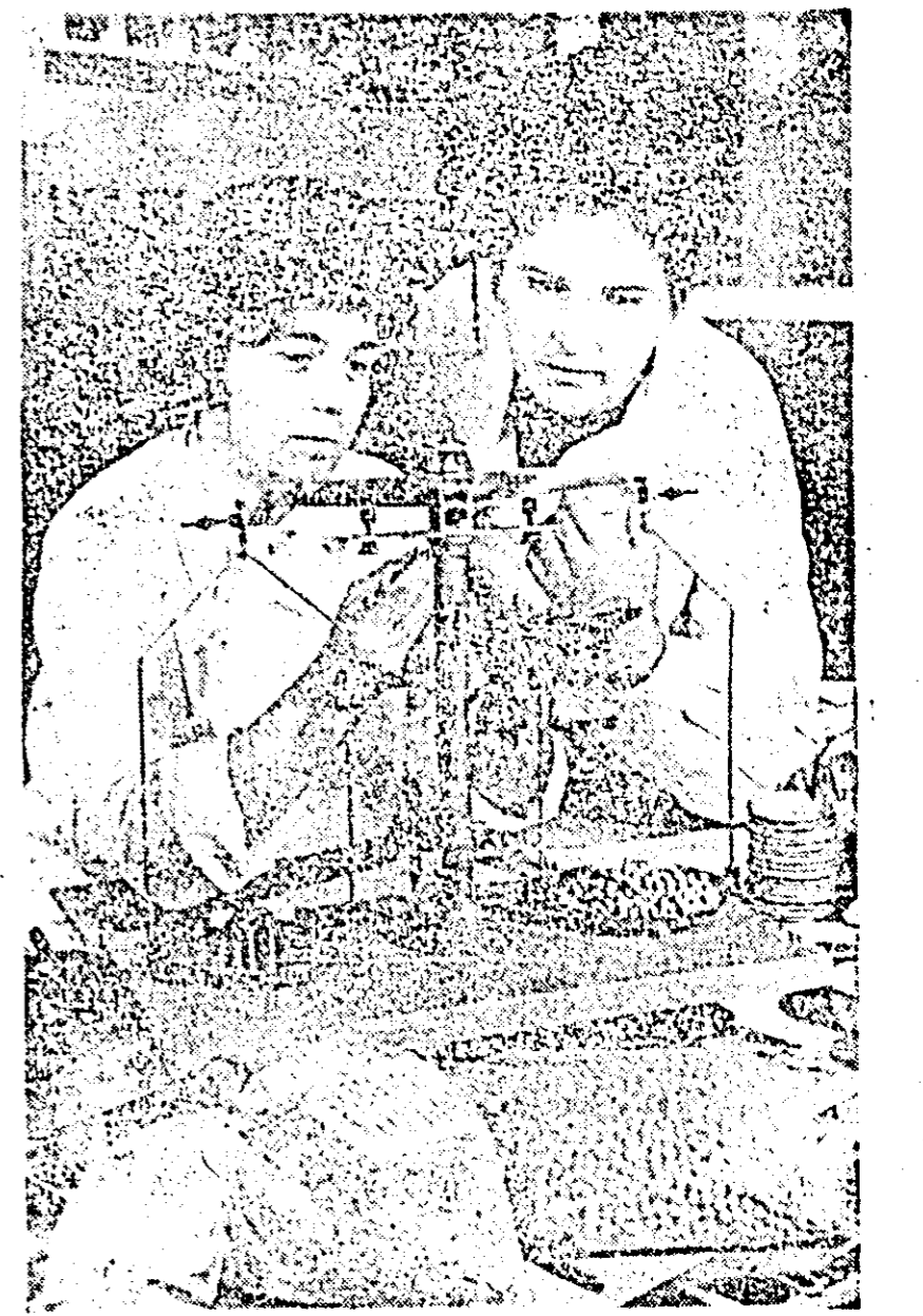
Instantaneu din laboratorul județean de control al semințelor.