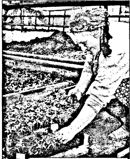
Aici își câștigă unii curticeni pâinea de zi cu zi...