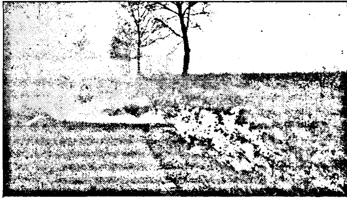
Fumul împiedică circulația, transformând viața șoferilor în iad

vinovați de dezastrul ecologic de pe marginea șoselelor. Sau, mă rog, având în vedere că dumnealor gestionează aceste porțiuni, ar trebui să știe, fără doar și poate, cine este responsabil pentru acest mod de distrugere a semințelor de buruieni. Știu că legea nu permite să se incendieze nici măcar miriștea,