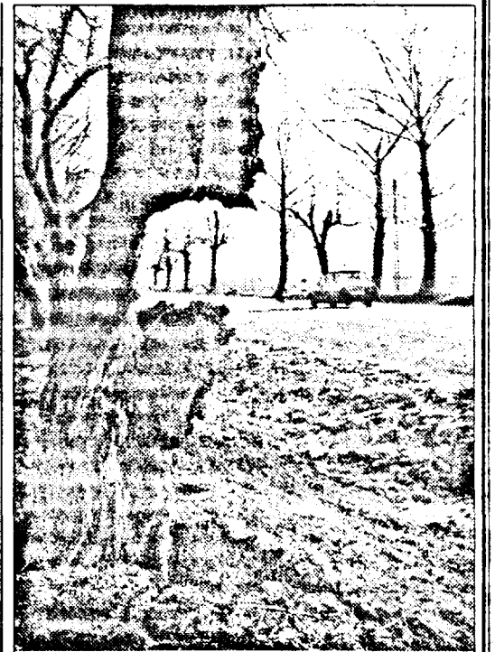
Focul a mușcat adânc din copaci, ucigând orice șansă a acestora de a mai „respira”