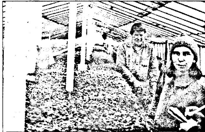
Proprietara solarilor muncește cot la cot cu angajații...