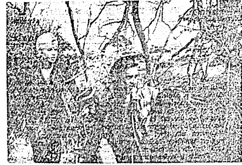
Pe ecranul cinematografului „Ch. Doja” din localitate rulează în săptămîna aceasta filmul „Moartea în insula de zahăr”.