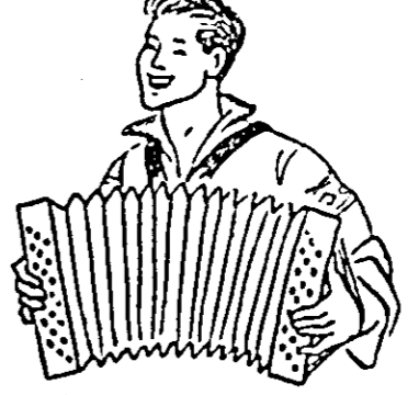
Peste 14.000 de spectatori