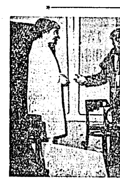
IN CLIȘEU: o scenă din piesa „Asta nu e sora mea” prezentată de colectivul artistic de la sindicatul lucrătorilor din învățământ.

A urmat apoi un bogat program cultural. S-au recitat poezii: „Sirena lui Roaită” de V. Porumbacu, „Partidul” de M. Bentuc și altele. Elevii claselor I-IV au executat cu multă grație dansul „Fulgior de