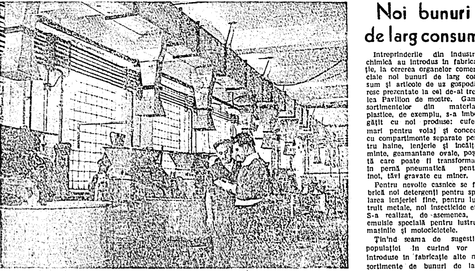
Fabrica de lacuri și vopsale „Transilvania” din Oradea a fost de curând înzestrată cu utilaj modern.