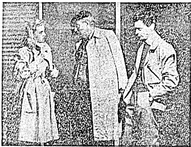
IN CLIȘEU: o scenă din piesa „Secunda 58” de Dorel Dorian.

Noua premieră a Teatrului de stat din Arad, „Secunda 58” de Dorel Dorian, aduce în fața spectatoilor una din problemele majore ale contemporaneității — problema răspunderii față de faptele noastre nu numai în muncă, dar și în situații mai gingașe, cum ar fi, de exemplu, dragostea.