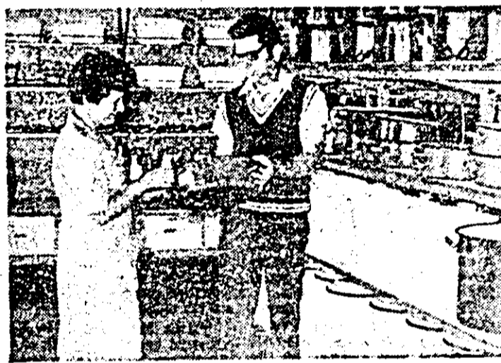
Secvență dintr-o zi în magazinul „Menajul” din Lipova.

● Un obicei rău, în dăuna călătorului cu tramvaul. Dacă, de pildă, la stația de la complexul Șega două tramvaie se ajung din urmă, al doilea face stație unde apucă, pornește apoi dar, nu mai oprește în stația propriu-zisă. Așa rămîn de... tramvai călătorii care nu pricep gestul arbitrar al valmanului. (Vezi tramvaul cu numărul de vagon 125, în dimineața zilei de 2 august).