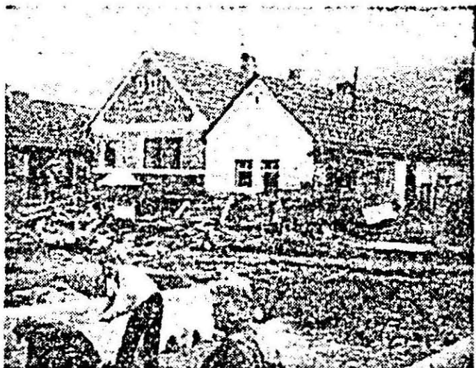
După ce furia apelor s-a potolit, oamenii sînt la datorie pentru refacerea podului din centrul satului.

La ora 19.00 cînd pună această discuție oamenii au sosit energic pentru demontarea celor două poduri de beton distruse care chează albiile văii și a cărului, se lucrează energic pentru înlăturarea urmărilor lăuate de furia apelor. 17 turlor de civili, am putut vedea și tinerii în uniformă militară. Sositii cu tehnica necesară, ostarșii noștri aduc o importanță și neașteptată contribuție la înlăturarea urmărilor provocate de inundații. În tot șir oamenii au fost cu unelte pentru degajarea gospodărilor de busteni și bolovani de nisipul adus de torentele refacerea gardurilor de degajare a apelor de pe turluri, fiind hotărîți să lupte în cel mai scurt timp urmăriile puternicelor viituri.