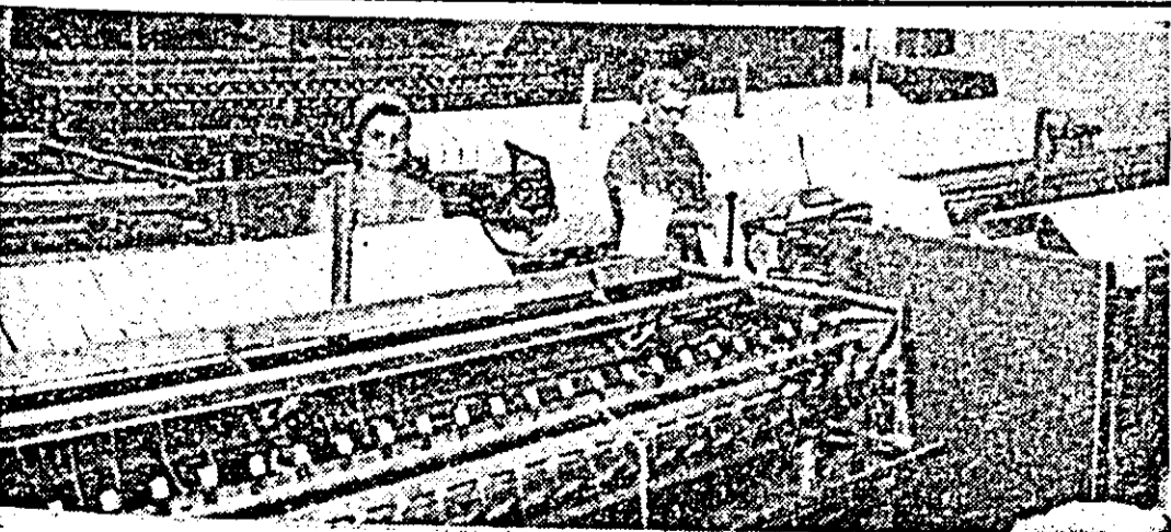
Întreprinderea textilă UTA. Secvență de muncă din atelierul de preparație.