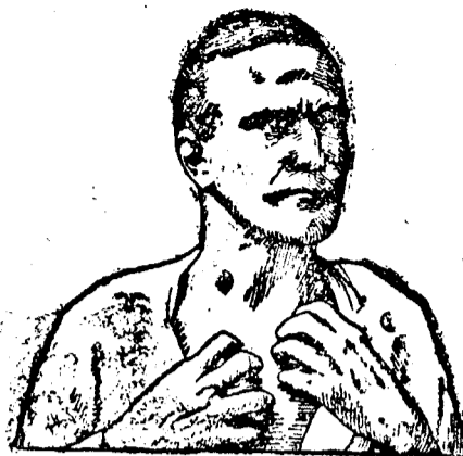
Ha hőrbetegségben szenved, használja a CADUM-KENOCSÓT