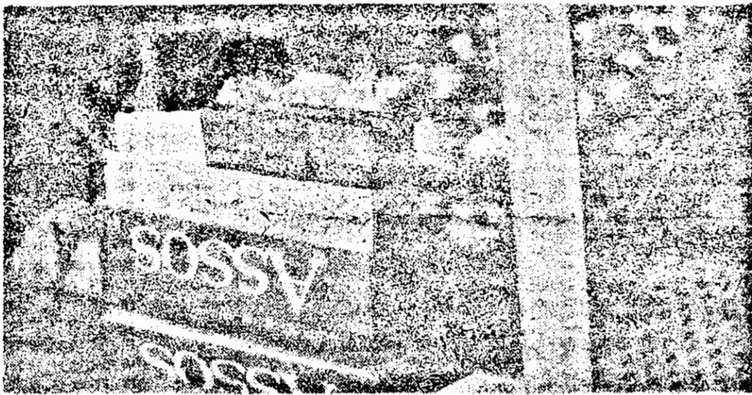
Precizare: morcele nu se vînd la tufungerie, ci țigările la legume-fructe.