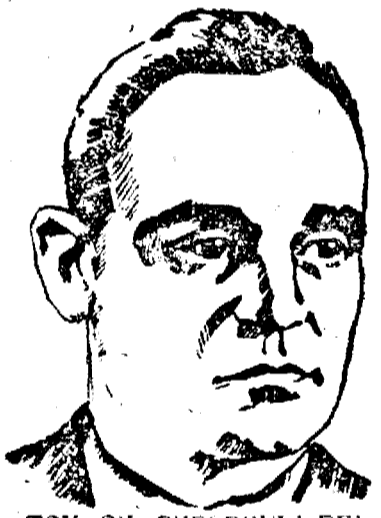
TOV. GH. GHEORGHIU DEJ

liste a noilor pretendenți la domi- nația mondială. Puternica mișcare muncitorească și democratică din toate țările repre-