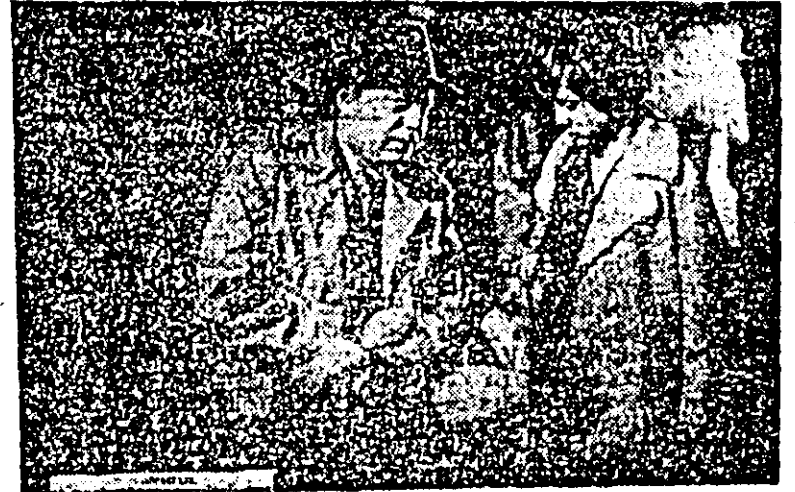
Secvență din film

Filmul rulează la cinematograful „Dacia”