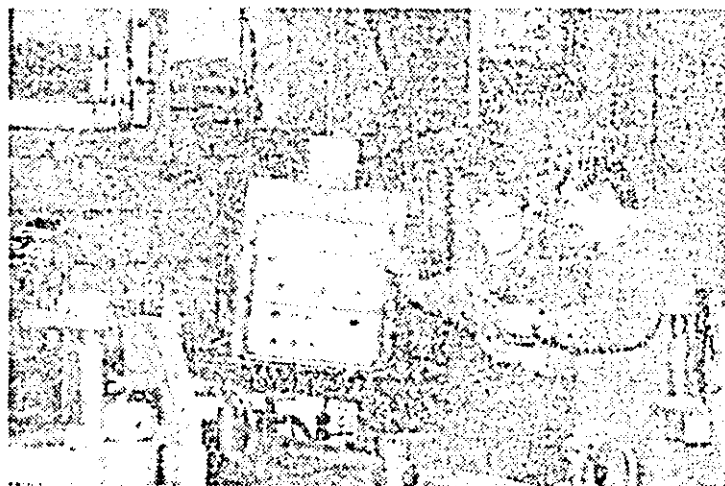
Aspect de muncă la Întreprinderea de vagoane Arad.

Preocupîndu-se temeinic de creșterea productivității muncii, colectivul muncitoresc de la Întreprinderea de producție și prestări a realizat în devans indicatorii de plan pe primele două luni din acest an. Ca urmare, sarcina de plan din această perioadă, la producția marfă industrială și prestări de servicii neindustriale, a fost realizată în proporție de 101,5 la sută, la prestări de servicii către populație — 128 la sută, la livrări către fondul pieții — 131 la sută, iar la desfaceri de mărfuri cu amănuntul 220 la sută.