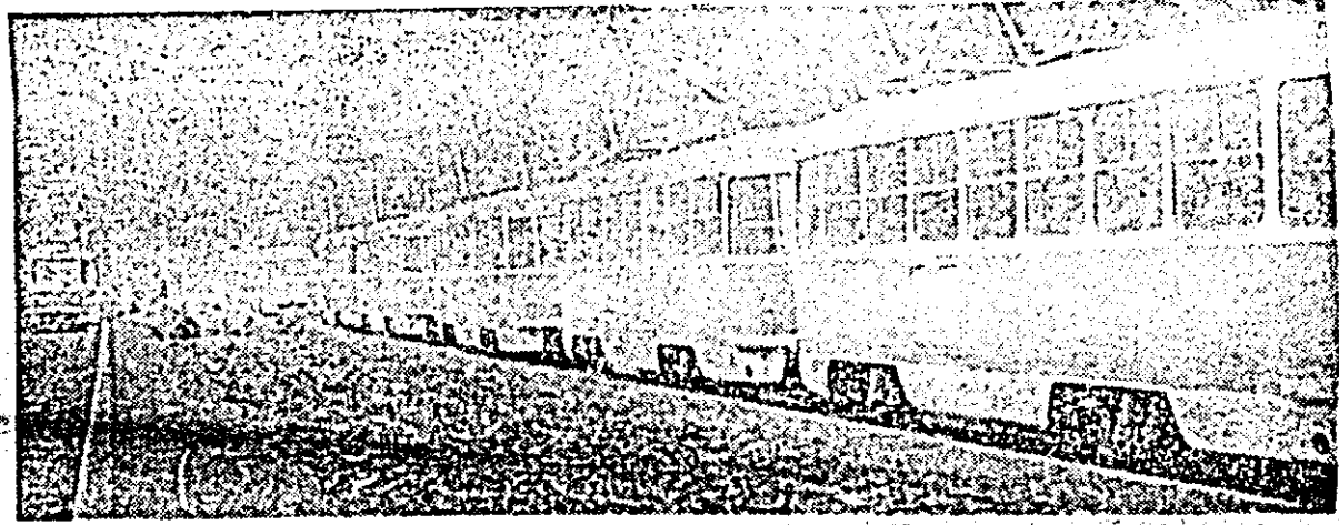
În ultima vreme sînt dese cazurile cînd tramvalele circulă defectuos. Aspecte ca cel din fotografia de mai sus se repetă, spre nemulţumirea călătorilor.