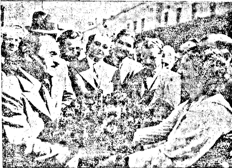
MIRCEA CANCECOV pénzügyminiszter virágcsokorral fogadják hazaérkezésekor

Canicov pénzügyminiszter az intézmények ama vezetői közül való, akiknek legnagyobb része van az említett lelki légkör kialakításában. Bár olyan tárca élén áll, amelyhez végzettszerűen a „végrehajtás“ és „pénzügyi terror“ kifejezések kapcsolódnak, tevékenységét úgy irányította, hogy a nagyközönségben lelkesedést vált ki nevének