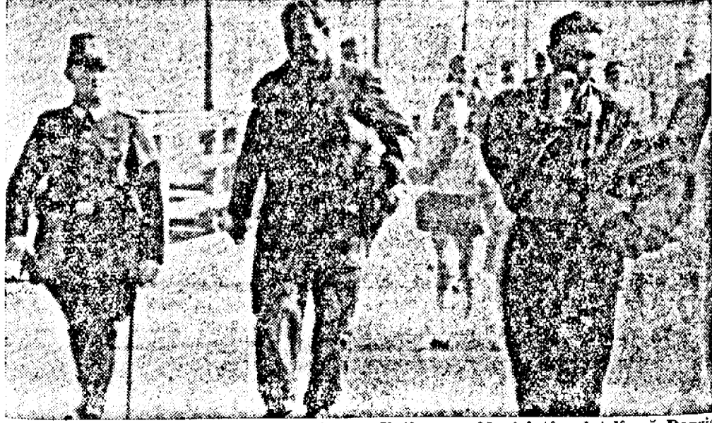
Doi aviatori polonezi scăpați ca prin minune dintr'un accident întâmplat lângă Danzab.