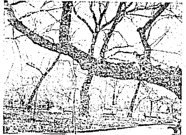
În așteptarea... primăverii.