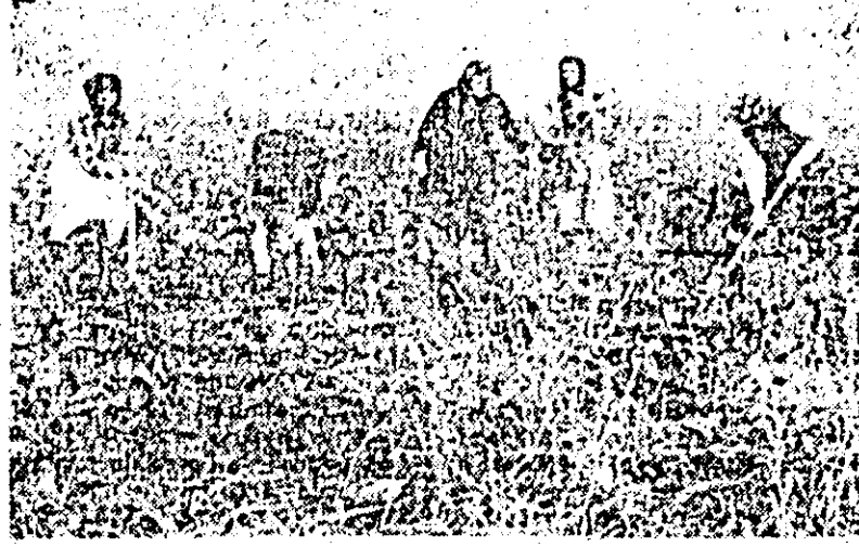
La GAP Sînlăeni se recoltează intens sfecla de zahăr.