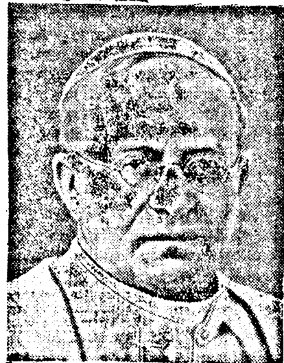
XI. PIUS PÁPA

Az olasz lapok közül többen annak a véleményüknek adnak kifejezést, hogy az osztrák szociáldemokraták a fegyvereket a csenektől kapták. A csehszlovákiai munkásság ma délelőtt öt perces tüntető sztrájkot tartott és így adott kifejezést rokonszenvének az osztrák szociáldemokraták fegyveres ellentállása mellett.