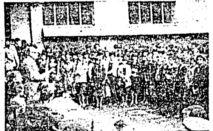
Elevii Liceului Industrial nr. 2 — înaintea primului clopoțel.