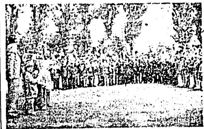
Cel mai mic elev al Școlii generale nr. 5.