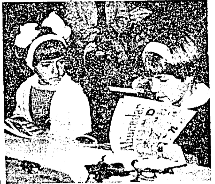
Liceul „Miron Constantinescu” — prima întîlnire cu abecedarul.

15 septembrie. În această zi, a început un nou an școlar, — încă o etapă de maximă importanță în amplul proces de pregătire a tinerii generații din patria noastră pentru muncă și viață. Și pentru tineretul studios din județul Arad, ziua de 15 septembrie a reprezentat (după cum ne-o dovedesc și instantaneele surprinse de fotoreporterii noștri) un moment sărbătoros, prilejuind exprimarea unei hotărîri unanime — de a nu preocupă nici un efort în vederea obținerii unor rezultate foarte bune în pregătirea școlară, pentru muncă și viață.