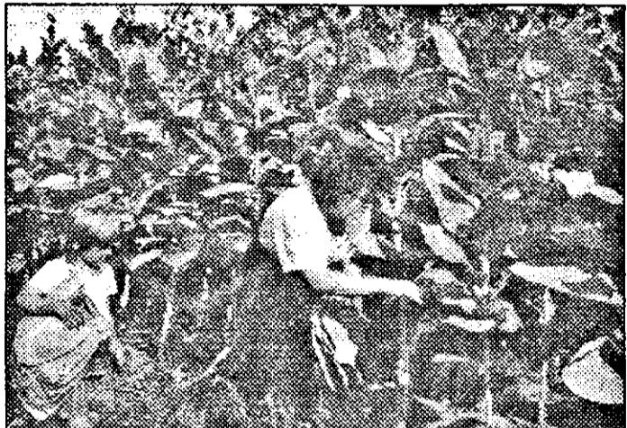
Întreținerea culturilor de tutun nu necesită eforturi deosebite, chiar și copiii putând participa eficient la această activitate.