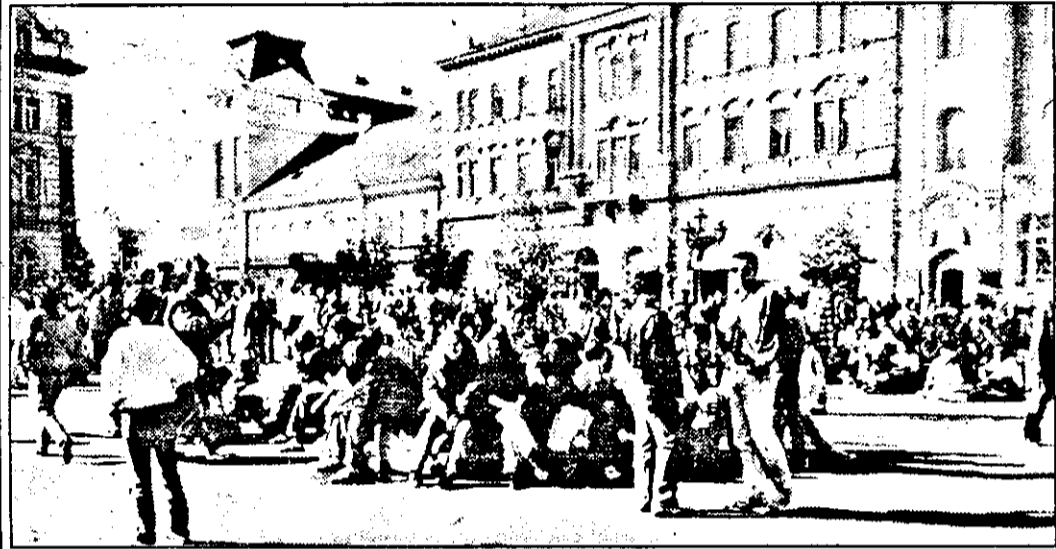
Când ești liceean, până și protestul îmbracă forme „dulci”.

Sigur, în trei zile nu poți avea pretenția că ai pătruns miezul lucrurilor și că ai ajuns să cunoști starea de spirit a