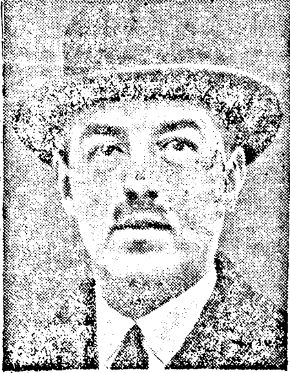
VAN ZEELAND belga miniszterelnök

LUXEMBURGBÓL jelentik: A belga frank értékesítése a luxemburgi frank értékének csökkentését vonta maga után. Néhány napi bizonytalanság után, most a bizalom újból kezd visszatérni. A kormány egyébként nagyhercegi rendelet formájában felhatalmazást kapott arra, hogy végrehajtsa a bank-