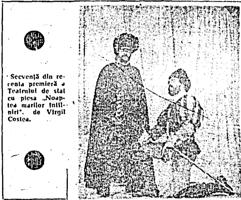
Secvență din recenta premieră a Teatrului de stat cu piesa „Noaptea marilor întâlniri” de Virgil Costea.