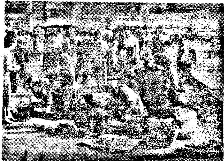
Piața Gării. De toate pentru toți: se vînd legume, fructe, juică, țigări, se efectuează schimb valutar.