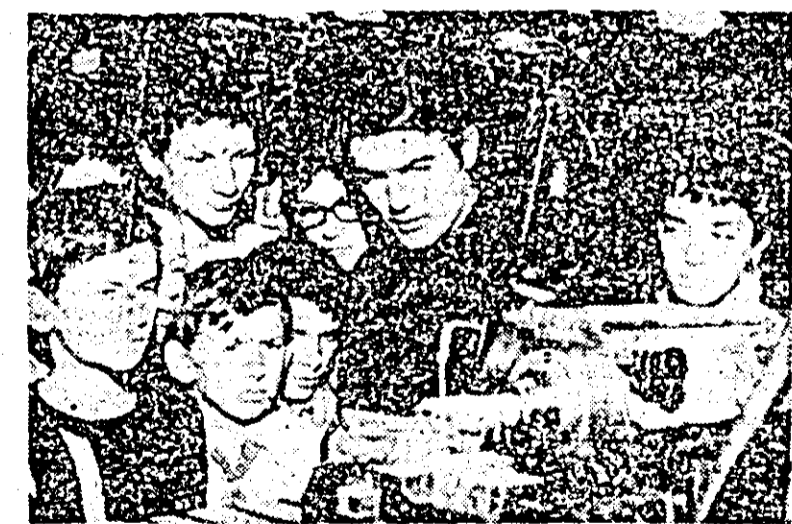
Un grup de pionieri în vizită la întreprinderea de strunguri.

I. COZMA, activist al Comitetului județean U.T.C.