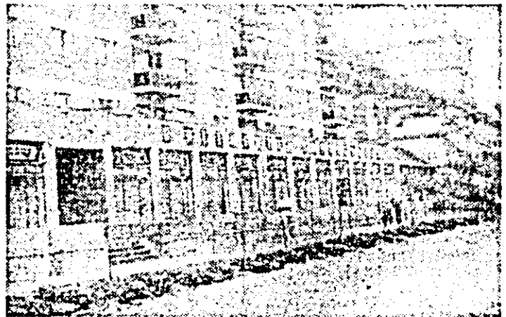
Aspect al noului complex comercial dat de curînd în folosință în orașul Sebiș.