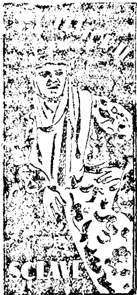
cu ANETA BACH

La 5, 7.30 și 9.30 cu prejur- regulate, la orele 3 intrare ge- nerală lei 45