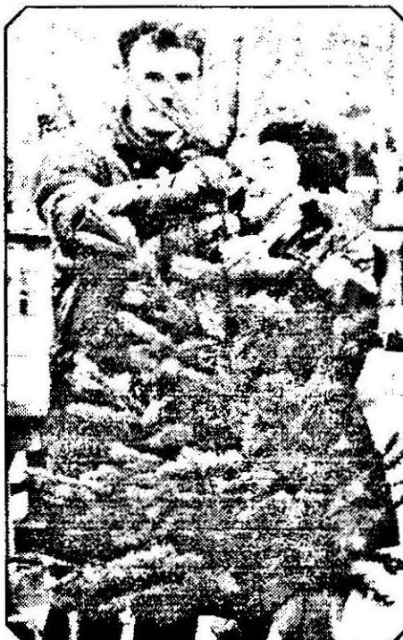
Un brad de Crăciun, cât jumătate din salariul unui om de rând. Sărbători la prețuri occidentale, calitate românească și salarii de mizerie.

Ar fi normal ca în fiecare casă, în seara de Crăciun, bradul să stea frumos împodobit în semn de prețuire a acestor sfinte sărbători. Lucrurile însă nu vor sta întocmai, din cauza exploziei prețurilor care au atins punctul culminant în urmă cu câteva zile. Astfel că, pentru a împodobi un brad de Crăciun, omul de rând are nevoie de nu mai puțin de două salarii. Când un simplu brad nu poate fi cumpărat sub prețul de 30.000 până la 40.000 lei, preț la care se mai adaugă bomboanele, globurile, beteala și instalația de iluminat, ajungi la concluzia că anul 1996 a adus pentru români sărbătorile cele mai scumpe. Doar un fir de beteală costă 3068 lei, în timp ce un vârf ornamental pentru pom nu poate fi cumpărat sub 8000 lei. Un glob costă între 3000-4500 lei, în timp ce o instalație de iluminat se ridică până la 20.000 lei (atunci când aceasta are 140 de beculețe).