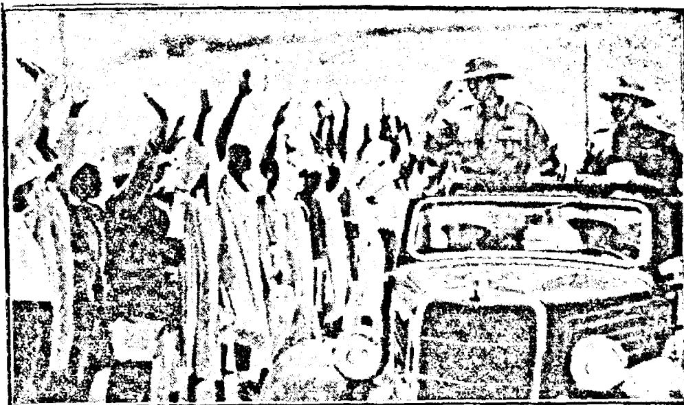
Viceregele Etiopiei ducele de Aosta înspectează Somalia engleză cucerită recent de trupele italiene. Populația prim este pe vicerege cu bucurie și recunoștință.

UN CONSILIU PREZIDAT DE D. GENERAL ANTONESCU, S'A ȚINUT IERI SEARĂ ÎNTRE ORELE 17.30 ȘI 21. S'A LUAT ÎN DISCUȚIE PROBLEMELE MARI ALE FIECĂRUI DEPARTAMENT ȘI MĂSURILE URGENTE IMPUSE DE SITUAȚIA ACTUALĂ A ȚĂRII.