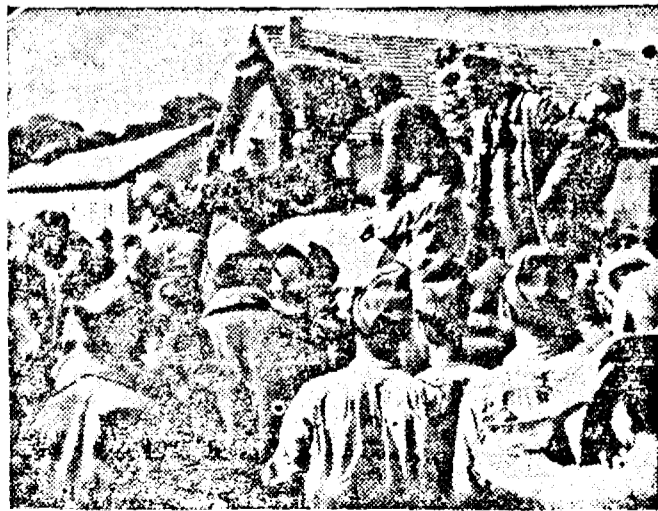
Intr'un lagăr de prizonieri francezi în Reich.