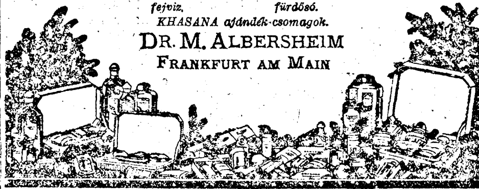
Képviselet és leakat Románia részére: „Gea”-Krajer Bész.-Társ. Timisoara I, Str. Gh. Lazar.