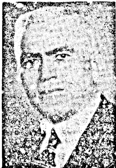
D. Dr. PETRU GROZA

Iată că la orele 10 fără 10 minute autorapidul ministerial intră în gară. Se observă o mișcare febrilă.