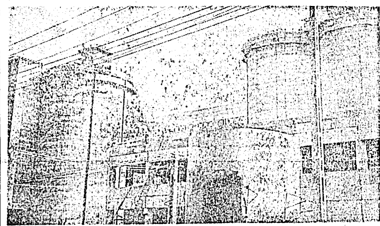
Combinatul chimic. Vedere spre turnurile de granulare.