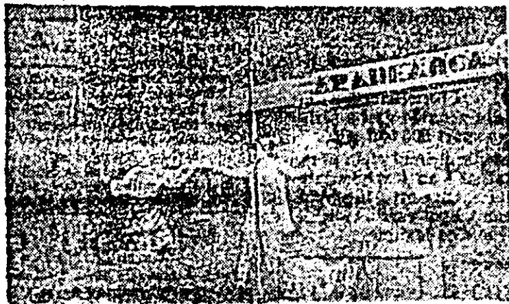
„Păpușa mult visată” — așa se intitulă dansul tematic realizat de artiștii amatori de la „Ardeanca”, dans dedicat calității produselor și popularizării mărcii întreprinderii.