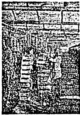
La Sintana legumicultu ra ocupă un loc impor tant. În seră culturile sînt bine îngrijite și în curînd va începe culesul primei recolte.

Una din indeletnicirile actuale, tradițională la rîndul sate, este transportul și aplicarea îngrășă mintelor naturale, unanim recu noscută pentru eficiența și bogă ția de substanțe fertilizante. În comparație cu aceeași perioadă a anilor trecuți, în județul nostru, gunoiul de grajd s-a administrat pe suprafețe mult mai mari, eva luat la peste 300.000 tone. Se ve de deci efectul unei mai bune or ganizări a muncii prin constitu irea și funcționarea a 12 formații specializate de lucru la această importantă acțiune, organizare ca re a dat roade mai ales în consi liile intercooperatiste din Vința, Nădlac, Sintana și altele, unde lu crările sînt susținute cu platfor me pentru încărcarea și descărca rea gunoiului de grajd din re morci, mașini de împănțire a în grășămîntului. N-ar fi însă coe ctect să apreciem că acțiunea se desfășoară peste tot cu bune re zultate. Ne-am întărit această convingere după ce zilele trecute am parcurs o parte din terenurile aflate în raza consiliului Intercoo peratist Tîrnova. Pînă săptămîna trecută, cele trei formații specia lizate, cu greiere și remorci, sau căruțele unităților cooperatiste, au transportat și s-au aplicat în grășămînt natural doar pe 540 hectare. La Drau s-au fertilizat doar 34 hectare cultură de cîmp, 7 ha pepinieră de viță de vie și 30 ha livadă de pomi. Gunoiul mai există destul, după însăși aprecierea to varșului Pavel Butaru, presedin-