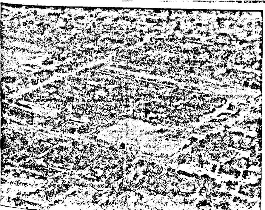
Un cartier din Chișinău ars și distrus cu desăvârșire de bolșevici. (R.K.W.)

Atunci când Marele Stat Major va crede că este necesar a se primi voluntari de războiu se vor da ordine pentru ca toți cei interesați să poată lua cunoștință.