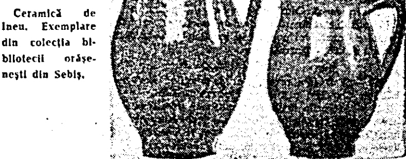
Ceramică de Ineu. Exemplare din colecția bibliotecii orașenești din Sebiș.