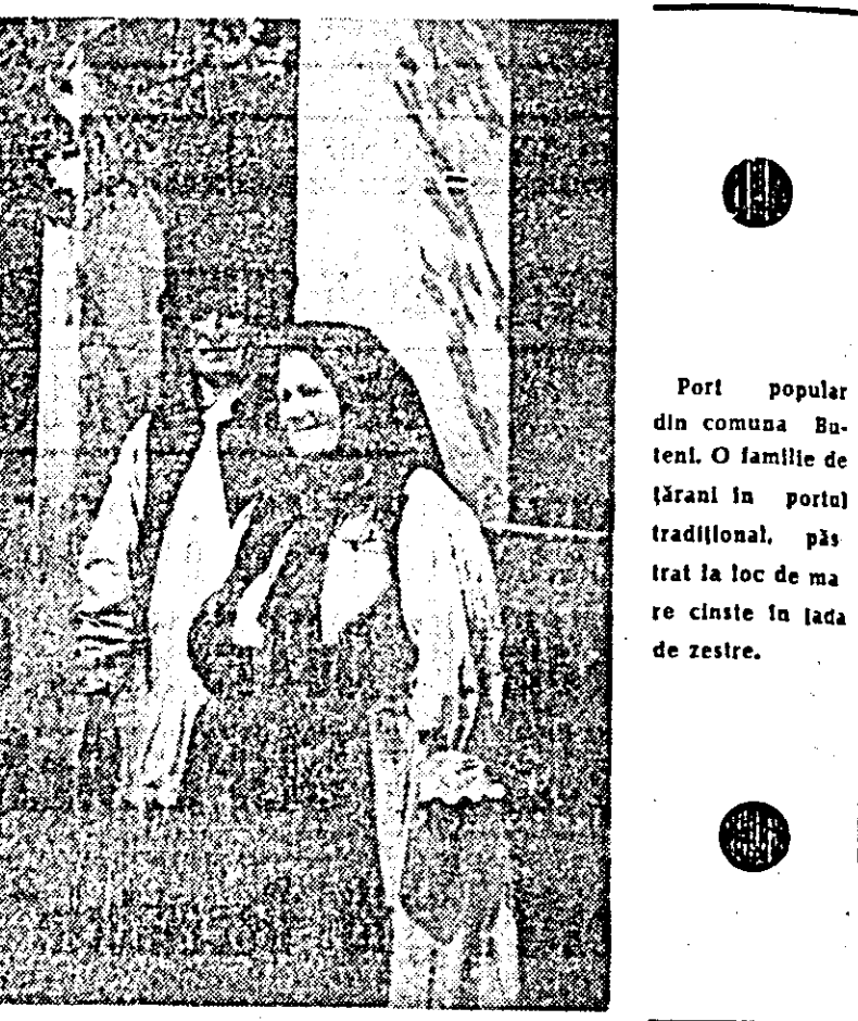
Port popular din comuna Buteanu. O familie de țărani în portul tradițional, păștrat la loc de mare cinste în jada de zestre.