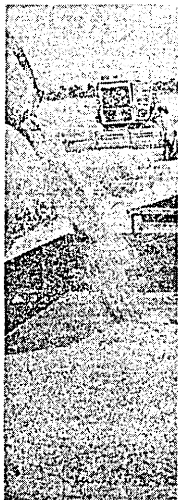
Se adună recolta de grlu de pe ultimele suprafețe.

întreaga perioadă de seceriș. Urmare a calității superioare a reparațiilor, precum și a exploatații raționale a combinelor, mecanizatorii au reușit să realizeze cele mai înalte