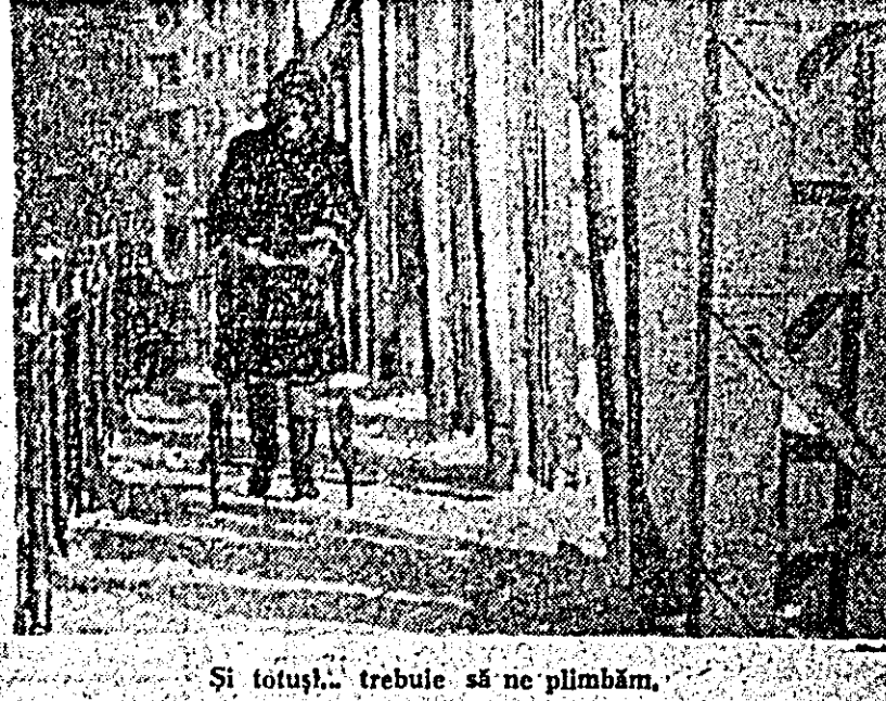
Și totuși... trebuie să ne plimbăm.

Timp de cîteva zile la Arad — a aflat în vizită de prietenie, delegația municipiului Prato din Italia, condusă de primarul acestuia, Giorgio Vestri. În timpul șederii în orașul nostru, delegația a avut întîlniri cu membrii ai Comitetului executiv al Consiliului popular al municipiului Arad și a fost primită la Consiliul popular al județului Arad. De asemenea, delegația a vizitat întreprinderi și instituții din oraș și județ, printre care