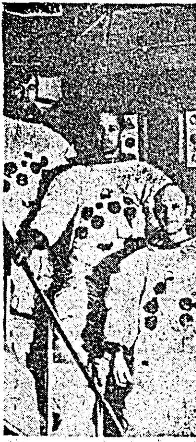
IN FOTOGRAFIE: astronauții noli misiunii: comandantul John W. Young, pilotul modulului lunar Charles M. Duke și pilotul modulului de comandă Thomas K. Mattingly, fotografiți pe scările unui simulator al navei „Centrul spațial” de la Houston.

Misiunea Apollo-16 va instala pe Lună o cameră cu raze ultraviolete și un detector de raze cosmice. Camera va permite fotografierea a aproximativ 10.000 de corpuri cerești, dintre care primele vor fi Pământul, galaxia Andromeda, Norul lui Magellan etc. Această cameră va trebui să detecteze prezența hidrogenului și a gazelor rare nu numai în sistemul solar, ci și în galaxiile cele mai îndepărtate. În sfîrșit, misiunea Apollo-16 va transporta, pentru prima dată, dus-intors, 60 milioane microți, grăunțe de creșon și de fasole și ouă de crevețe, cu scopul de a fi supuse radiațiilor care există la distanța de 400.000 km de Pământ.