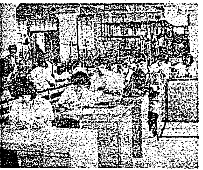
Aspect de muncă în atelierul montaj al întreprinderii de orologerie industrială Arad.

fecundității vacilor, alți prin intervenții terapeutice cu medicamente, cît și prin intervenții tehnologice. Referindu-mă la cele terapeutice amintesc folosirea produsului denumit „Folistim” preparat în colaborare cu specialiștii uni-