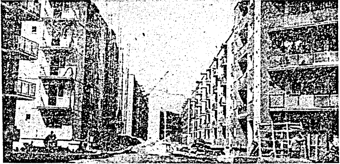
Harla municipiului nostru se îmbogățește mereu cu noi zone de locuințe, urmarea a grăbiilor partidului și statului de a crea condiții de viață tot mai bune pentru oamenii muncii. În fotografie: aspect din noul cartier Micăta Sud.

Oamenii muncii de la întreprinderea de construcții-montaj a județului Arad, puternic angajați în întrecerea socialistă, au dobândit meritorii succese. Astfel, efortul conjugat al tuturor s-a materializat, după șapte luni de intensă activitate, în realizarea suplimentară a 310 de apartamente. De asemenea, planul valoric la construcții-montaj a fost depășit cu 0,3 la sută. În cinstea sărbătorii naționale a României, constructorii arădeni sînt ferm hotărâți să realizeze planul la apartamente, atât cantitativ cât și calitativ, mai mult chiar, să mărească avansul înregistrat la nivelul primelor șapte luni ale anului.