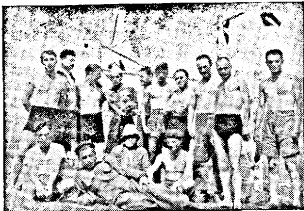
Un cercetaș polonez în mijlocul unui grup de străjerei-comandanți