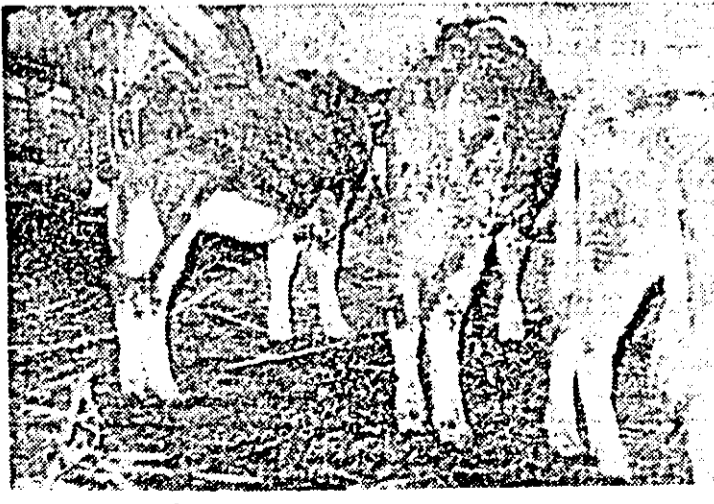
La C.A.P. Răpsig, animalele sînt murdare, neîngrijite și furajate ca vai de lume.