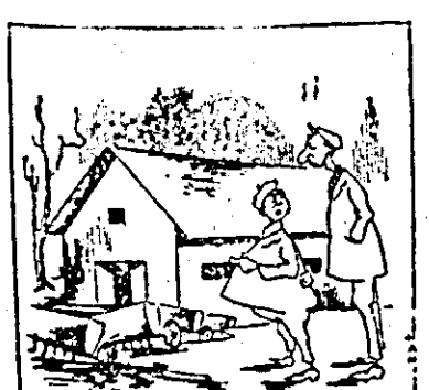
Le în în apă. Poate mai crește!