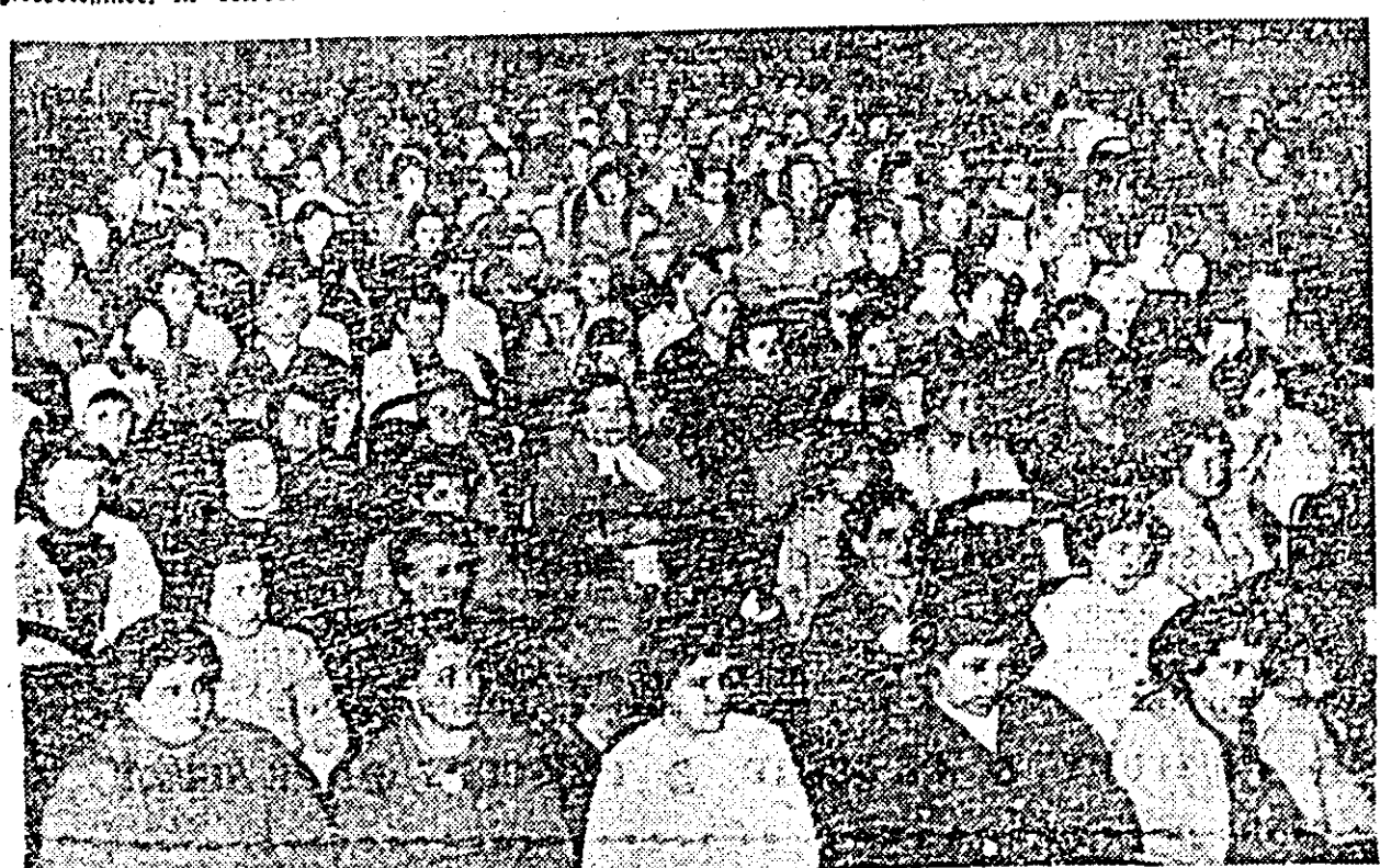
Fotografia noastră prezintă un aspect din timpul lucrărilor conferinței organizației orașenești a femeilor.

Munca culturală de educare a conștiinței socialiste a femeilor dușă de comitetul orașeneș de femei a cuprins mij de femei din întreprinderi, instituții, unități agricole socialiste, circumscripții electorale și cartiere. Cercurile de citit — forma cea mai răspîndită — au devenit mici centre de educare a femeilor. Un rol însemnat în culturalizarea femeilor au avut și lectoratele, ciclurile de conferințe și altele. Edificator pentru conștiința și varianta de citit și lectorate a fost conferința din experiența valoroasă în culturalizarea femeilor din cartierul Drăgășani. La început a fost creat un nucleu de femei harnice, care a căutat cele mai variate forme de atragere a femeilor la activitatea comitetelor de femei. În cadrul cercurilor de citit și a lectoratelor, a statului gospodinei ele au chemat în mijlocul femeilor pe medici care le-au vorbit de importanța curățeniei în prevenirea bolilor, profesori care le-au vorbit de educația copiilor, specialiști ai cooperativei „Artex” care au vorbit femeilor despre îmbrăcăminte și modă, au chemat bucătari renumiți din