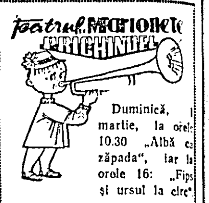
Duminică, 10.30 „Albă ca zăpada”, iar la orele 16: „Fips și ursul la cire”