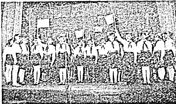
Montajul literar-muzical prezentat de pionierii clasei a III-a de la Școala generală nr. 12 Arad.