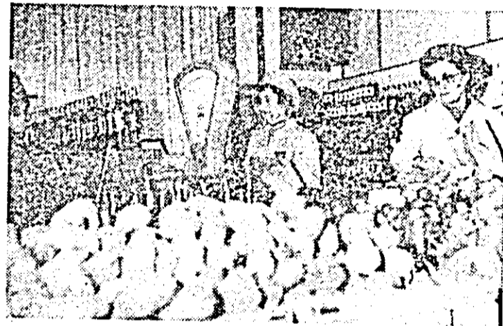
Secvență dintr-o unitate fruntașă: magazinul I.J.L.F. nr. 2.

— Vorbiți-ne despre rețeaua de desfacere. Ce preocupări e-