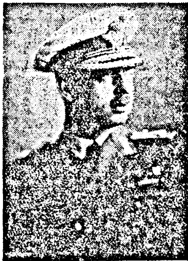
M. S. REGELE CAROL II.

Primele mele cuvinte îți exprimă surprinderea și admirația pe care o încerc regăsind după un lung interval un oraș cu totul deosebit de acela pe care-l cunoscusem.