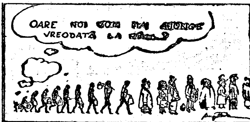
Caricatură de HORIA SANTAU, Arad